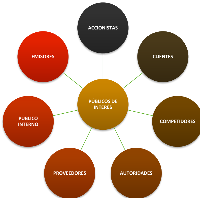
Figura 1. Públicos de Interés para Mercado de Valores

Se finaliza con la identificación de los públicos de interés como parte del proceso de transición a la norma ISO 9001:2015, lo cual permitirá además alinear estratégicamente la responsabilidad social empresarial y en cumplimiento de las buenas prácticas de la ISO 26000. Las partes interesadas pertinentes para Mercado de Valores se muestran en la Figura 1.